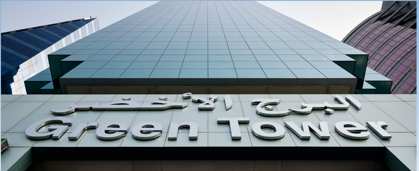
Green Tower, Deira, Dubai