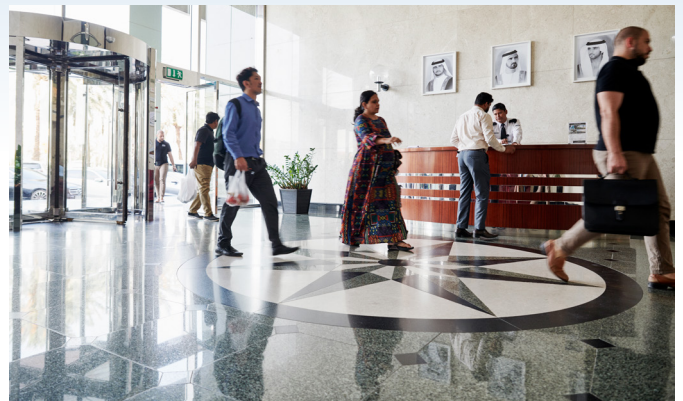
Die neuen HKL-Pumpen im Green Tower verbrauchen infolge der Nachrüstung beim Kühlen des Bürogebäudes 57 % weniger Strom als vorher.

„Wir müssen nur zu ihnen durchdringen. Damit ist das Ventil schon fast offen“, gibt er sich überzeugt. „Das ist keine Traumtänzeri oder etwas Unmögliches. Es liegt direkt vor uns und lässt sich ganz einfach erreichen.“