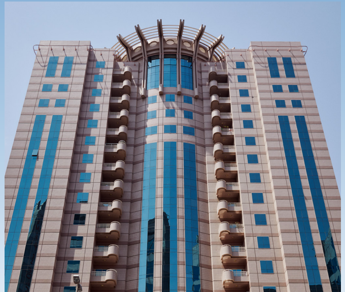
Falcon Tower, Deira, Dubai