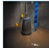
Pystysuuntainen uppoasennus rengastuolle

Grundfosin SE/V-, SL/V- ja SEG-pumput soveltuvat teollisuuden jäteveden pumppaukseen.