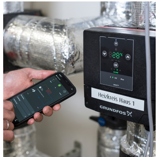
L'interface sans fil permet de mettre en service et de surveiller l'unité de commande MIXIT à l'aide de l'application Grundfos GO Remote.

À l'avenir, OVE prévoit d'utiliser la technologie MIXIT non seulement pour les nouvelles installations, mais aussi lors de la modernisation d'anciens systèmes ayant été installés avec des boucles de mélange traditionnelles. En ce qui concerne la solution sur le cloud, l'entreprise sous-traitante envisage déjà de remplacer les anciens modèles MIXIT. « À l'avenir, l'objectif est de surveiller le plus grand nombre possible de systèmes que nous gérons à l'aide de Grundfos BuildingConnect ; cela inclut la surveillance des messages d'erreur et la planification des cycles de maintenance », explique M. Grafe. « D'ici un ou deux ans, je prévois que nous aurons accès à plus de 100 boucles de mélange via le cloud. »