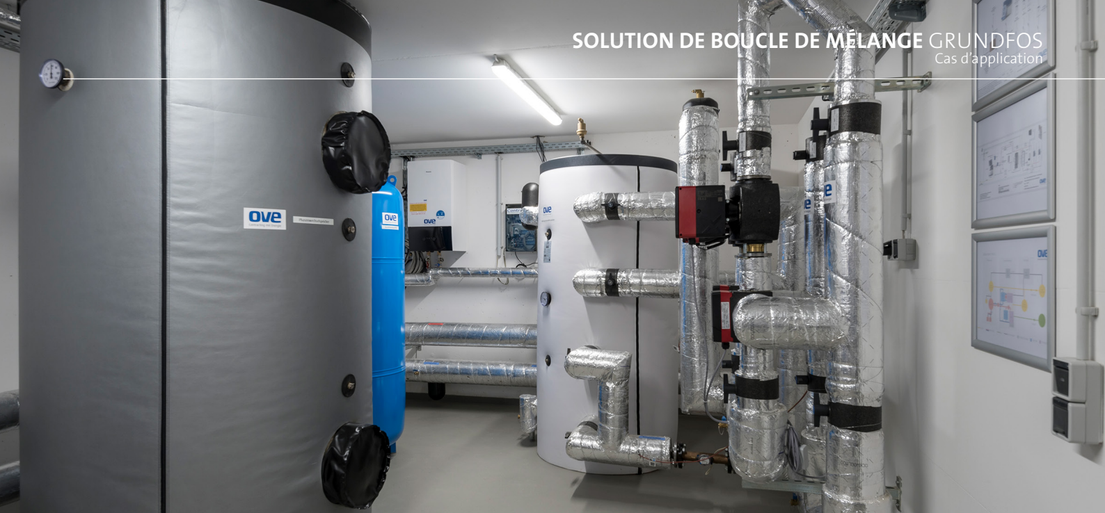
Le local technique du lotissement avec centrale de cogénération et de stockage à changement de phase, stockage tampon, pompe à chaleur et boucles de mélange