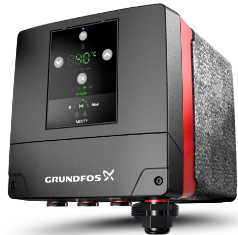
L'unité de commande MIXIT avec robinets à boisseau sphérique intégrés, clapet anti-retour, moteur pas à pas, capteurs de température et de pression et contrôle intelligent de la température.

La chaleur est principalement générée par une centrale de cogénération fonctionnant au gaz d'une puissance thermique de 21 kW et d'une puissance électrique de 9 kW. La chaleur découplée de 70 °C à 80 °C est stockée à l'aide d'une mémoire de changement de phase pour assurer une durée de vie optimale du système d'au moins 3 500 heures de fonctionnement annuel. L'autre générateur