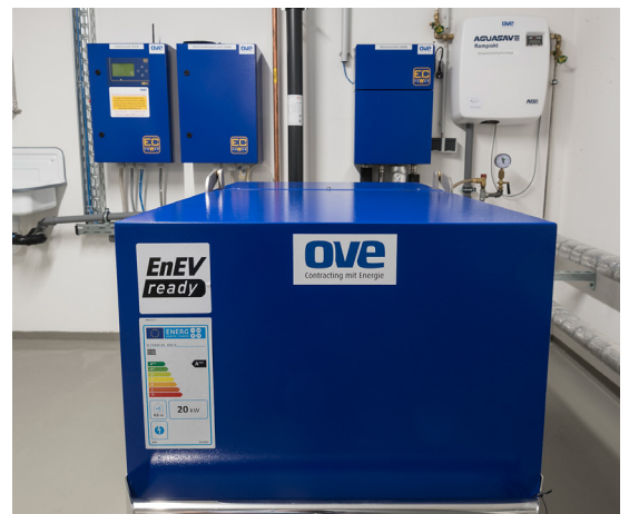
Le générateur de chaleur principal est un système de cogénération compact avec 21 kW de puissance thermique et 9 kW de puissance électrique.