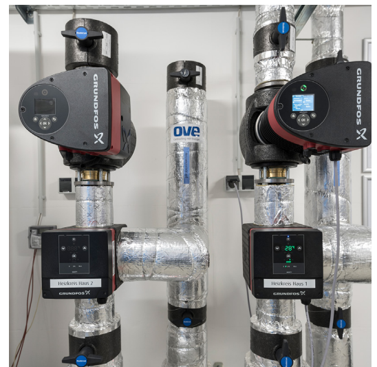
Boucles de mélange pour les phases de construction 1 (à droite) et 2 (à gauche), chacune avec unité de commande MIXIT et pompe de circuit secondaire MAGNA3.

OVE considère l'accès en ligne à de nombreux points de données comme un énorme avantage. « En tant qu'entreprise de sous-traitance, il est important pour nous de pouvoir surveiller en permanence le fonctionnement de la boucle de mélange et de l'optimiser selon les besoins », observe M. Grafe. « Une boucle de mélange avec des composants individuels nécessite un contrôleur séparé. Cela entraîne un coût et des efforts considérables, mais en fin de compte, tout ce qu'il fait est de contrôler le mélangeur. Avec la solution Grundfos, l'unité de commande nous permet de contrôler de nombreux autres points de données ainsi que d'accéder au fonctionnement de la pompe. Cela nous permet de surveiller en permanence les temps de fonctionnement, le débit volumique, la vitesse et la consommation d'énergie de la pompe. L'unité de commande nous donne un contrôle total sur l'ensemble du fonctionnement de la boucle de mélange à tout moment. »