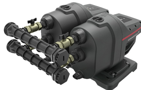
Grundfos SCALA1 – zestaw dwupompowy