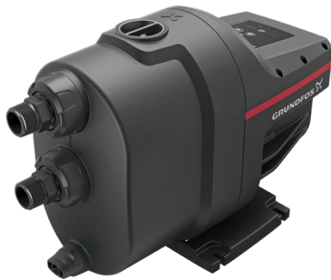
Grundfos SCALA1 – pompa pojedyncza

Jeżeli potrzebna jest większa wydajność, to można ją łatwo uzyskać przez połączenie dwóch pomp. Taki zestaw konfiguruje się za pomocą aplikacji Grundfos GO REMOTE.